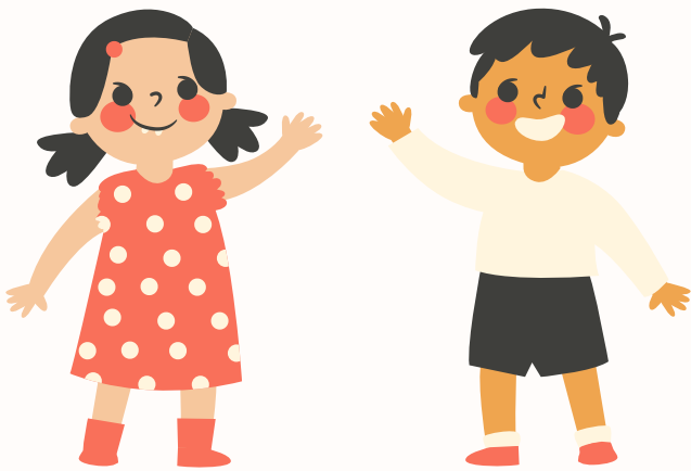
Un coucou de la main

Accompagne ton bonjour matinal avec le geste de ton choix !