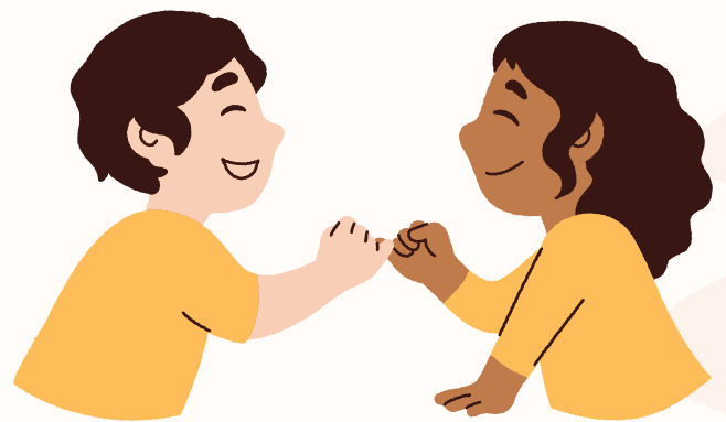
Les petits doigts